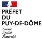
Schéma départemental des gens du voyage - CC AMBERT LIVRADOIS FOREZ État des lieux (mise à jour: septembre 2021)