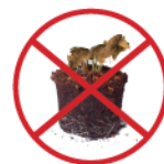
Mottes de terre