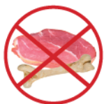
Os et restes de viandes