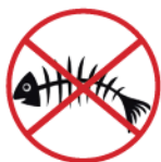
Poisson et restes de fruits de mer