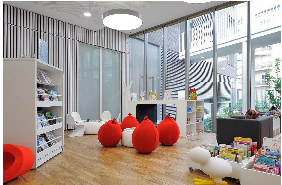
Exemple : Médiathèque Lacassagne (Lyon)

Calendrier de mise en œuvre : été 2020 ?